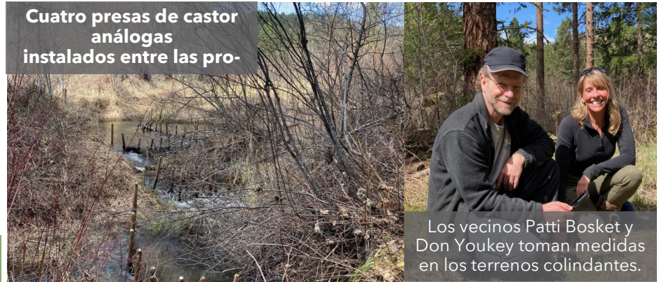
Cuatro presas de castor análogas instaladas entre las pro-

"Ahora necesitamos a los castores más que nunca", dice Patti. "El agua es una gran preocupación, ya que aquí todos dependemos de los pozos. Y los castores ayudan a restaurar el acuífero. Son muy importantes". Patti señala que Eagle Creek también se considera un punto caliente para futuros incendios forestales. "Cada vez hay más gente que tala sus árboles", dice, "pero los castores y los estanques que crean podrían darnos más cinturón verde", que