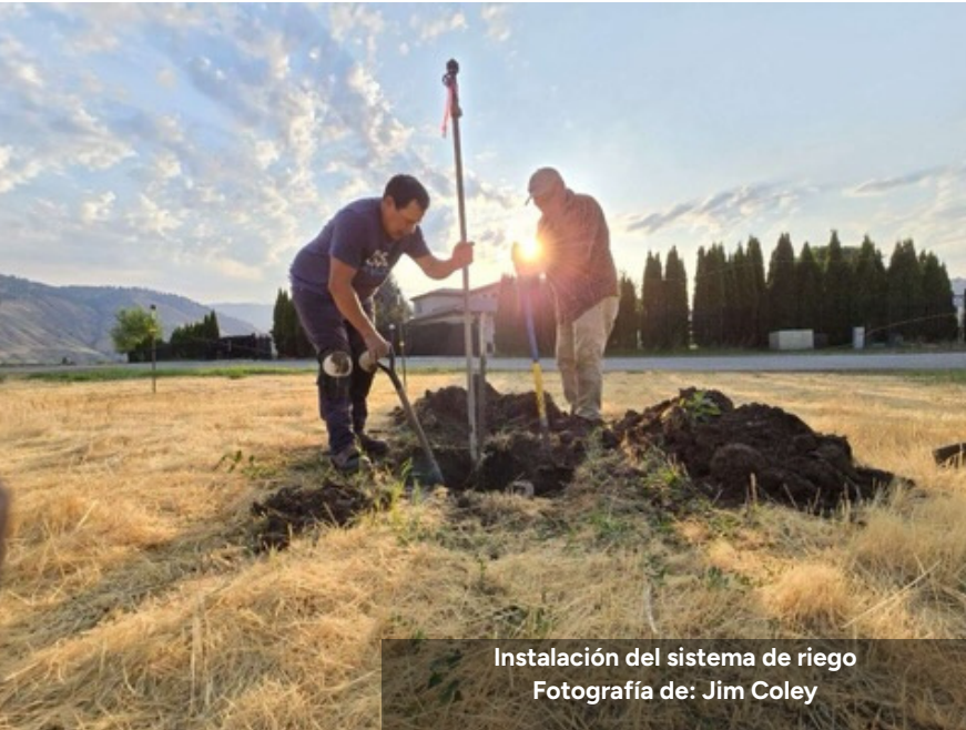
Instalación del sistema de riego