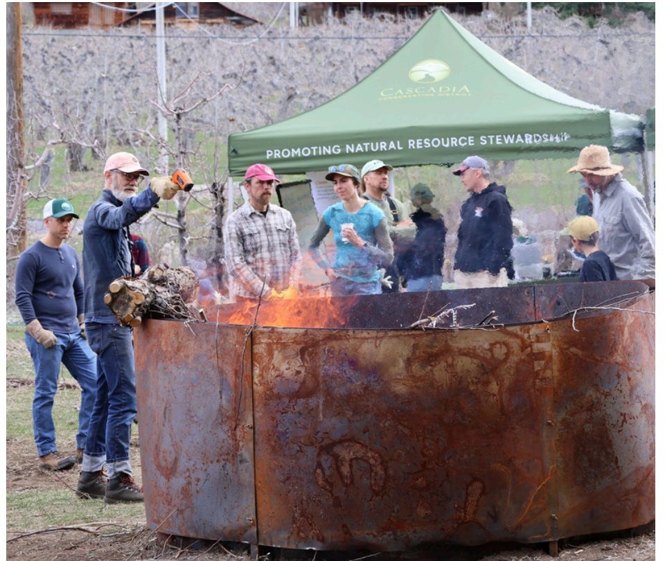
Participantes del taller, vistos a través de la bruma de calor del horno de biocarbón, el 20 de marzo.

En una encuesta realizada tras el taller, un participante comentó: "El taller en su totalidad fue excelente. Todos los ponentes aportaron información muy útil y demostraron gran conocimiento y experiencia en sus respectivas áreas. Al inscribirnos, pensamos que entraríamos y saldríamos a lo largo del día, ya que seis horas nos parecían mucho tiempo. Sin embargo, el tiempo pasó volando y había tanto que aprender que no nos fuimos; ¡no queríamos perdernos nada!".