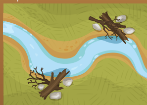
Mejoras en el estanque